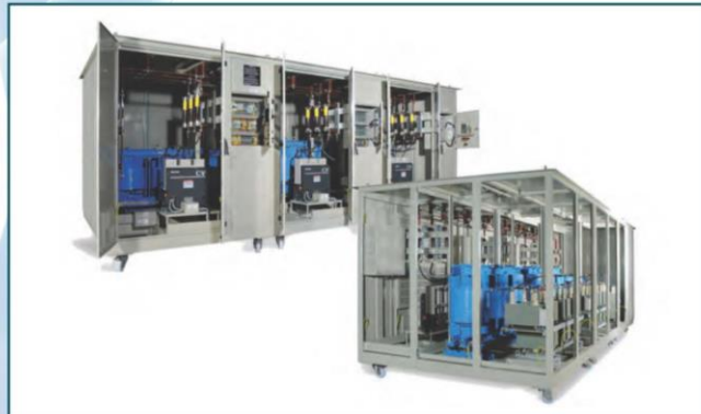
Baterías de condensadores en alta tensión con filtros de armónicos High voltage capacitor banks with detuned filters