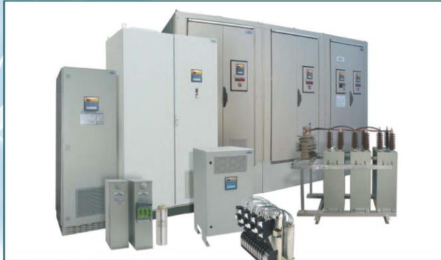
Baterías de condensadores en baja y alta tensión High and low voltage capacitor banks